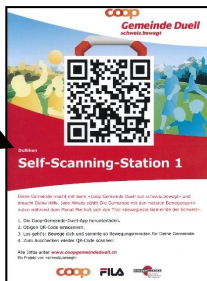
Bild von Self-Scanning-Station

Gemeindename muss mit der zu Unterstützenden Gemeinde übereinstimmen