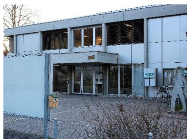
Gegenüber der Gemeindeverwaltung