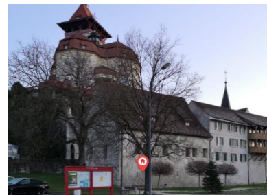
Schlossgarten Nähe Bushaltestelle Falkenstein