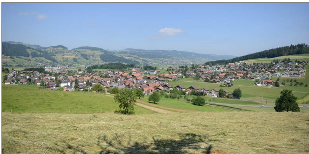
Foto: Seftigen bei Thurgau